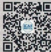
Focus on icas WeChat platform

Certification and Accreditation Administration of PRC:CNCA-R-2003-117 Tel: 400-633-9001 / +86 021-51114700 Web: www.icasiso.com Add: Room 801,HuaDing Mansion, 2368# West Zhongshan Rd., Xuhui District, Shanghai, China, 200235